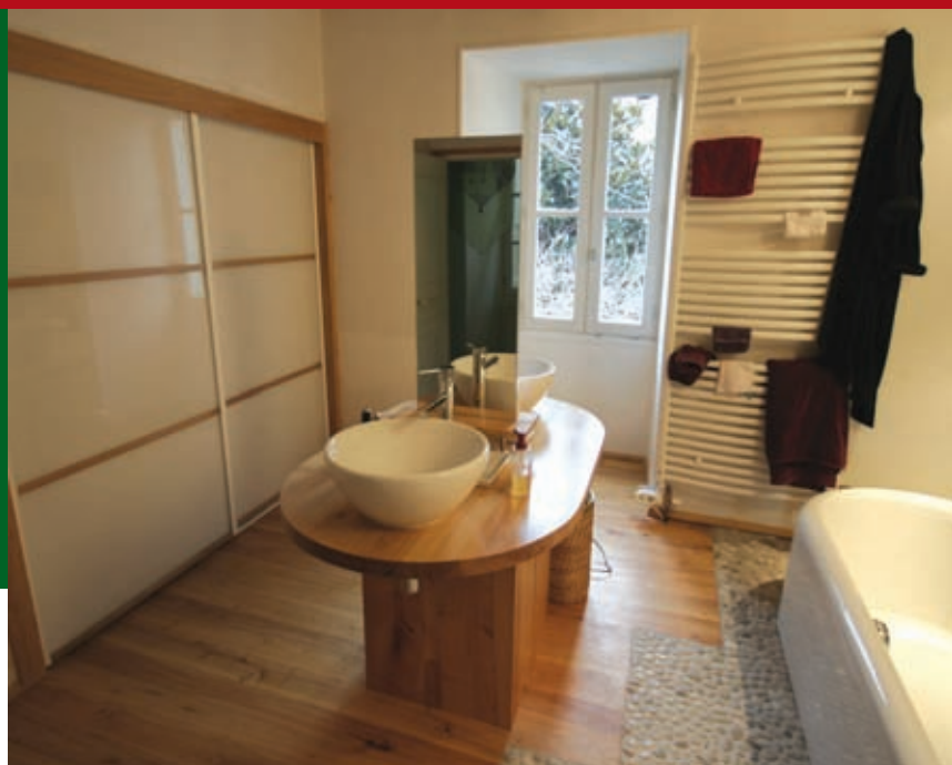
Réalisation : plancher "Périgordparquet" essence Acacia

Ci-contre : salle de bain présentant un audacieux mélange de galets et de lames de plancher en acacia. La tonalité miel apporte une note esthétique et claire, et confère à l'ensemble un caractère éminemment contemporain.